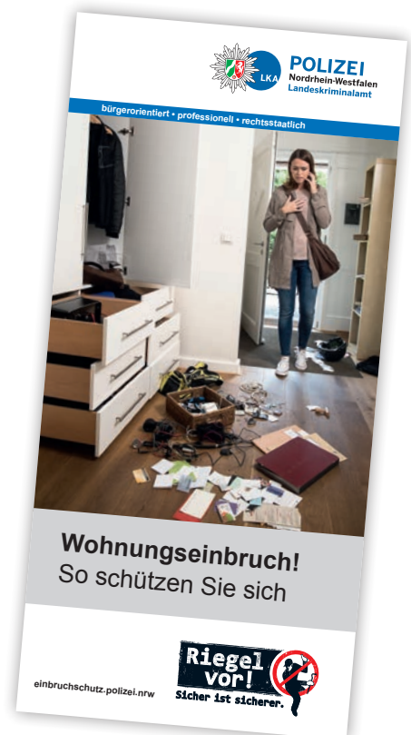
Informationsflyer „Riegel vor“ des Landeskriminalamtes Nordrhein-Westfalen

Übrigens: Auch aufmerksame Nachbarinnen und Nachbarn können Einbrüche verhindern. Sie sollten in Verdachtsfällen die Polizei unter der Rufnummer 110 verständigen.