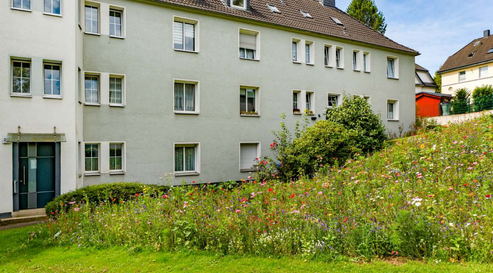
Blumenwiesen in der Gottfried-Wetzel-Straße